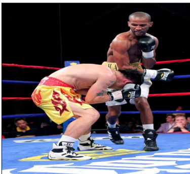
El púgil cubano Rancés Barthelemy de frente

En el segundo asalto volvió a tomar ventaja frente a su rival y ya casi en los segundos finales le provocó un conteo y después lo noqueó con una combinación de derecha abajo y una izquierda cruzada al mentón, que lo sacó fuera de combate.