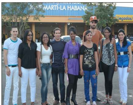
Jóvenes estudiantes cubanos minutos antes de abordar el avión que los llevaría a los Estados Unidos

"Somos un solo pueblo" es el programa que