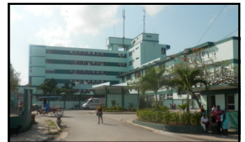
Hospital General Docente Mario Muñoz de Colón

Colón, Matanzas. Al arribar al aniversario 55 de su fundación el Hospital General Docente Mario Muñoz de la ciudad de Colón mantiene en jaque a sus trabajadores por las demoras presentadas para el pago salarial. El pasado martes 7 de enero en medio de visitas provinciales y actos conmemorativos el personal implantado se quejaba del incumplimiento del término establecido para la