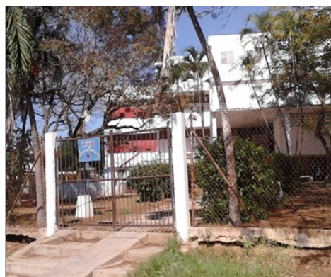
Escuela Secundaria Básica Antonio Rodríguez de Colón

Perico, Matanzas. A partir del 1ro de enero se puso en vigor un nuevo sistema de evaluaciones para los estudiantes que cursan la enseñanza Secundaria Básica bajo la Resolución Ministerial 14/2013 que derogando la Resolución 120/2001 recoge la cantidad de evaluaciones a realizarse por asignatura así como las que se valorarán con trabajos de controles y pruebas finales.