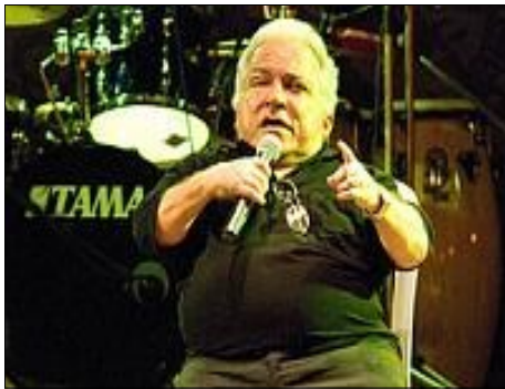
Nelson Ned, el pequeño gigante de la canción

Redacción: Murió el pequeño gigante de la canción Nelson Ned, el pasado domingo 5 de enero tras ser hospitalizado el día antes en la tarde luego de contraer una grave neumonía. Dijo el Secretario de Salud de Sao Paulo.