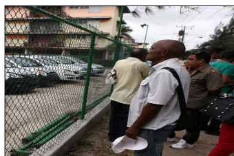
Agencia Comercializadora en La Habana que exhibe carros de segunda mano a la venta

motor de 15 años de explotación debe contarse con $ 331 250.00 MM que equivale a un trabajador promedio con salario de $ 400.00 MN a 828.125 meses de salario que correspondería a 69 años de trabajo. Teniendo en cuenta que la edad laborar comienza a partir de los 17 años de edad tendría que vivir 86 años para efectuar la compra sin haber desviado un solo céntimo para otra necesidad vital o de cualquier índole.