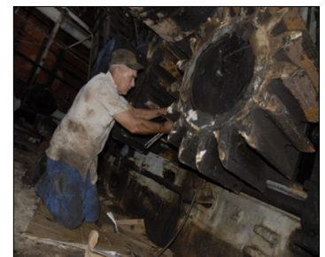
Reparación en el Central Mario Muñoz Monroy del municipio Los Arboles

La Industria Azucarera constituyó no solo en la provincia sino en todo el país el sector principal entre