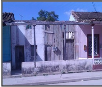
En Calle Ricardo Trujillo, en Colón