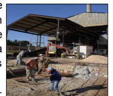
Obreros laboran en el central René Praga Moreno de Colón

otras razones, por su peso decisivo en la dinámica reproductiva, así como en la definición del patrón histórico de inserción internacional de la economía es por ello que azucareros no se explican la no asignación de presupuestos estatales que garanticen un periodo de molienda a la altura de los rendimientos y en correspondencia con el deterioro de estos colosos de hierro.