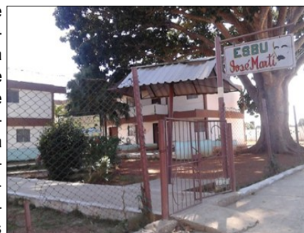
Escuela Secundaria Básica José Martí de Colón

<<La ministra apretó ¿Cómo es posible que luego de haberse iniciado el curso escolar hace unos meses se atreva a ser modificaciones de este tipo a el sistema de evaluaciones?...>> y añadió <<...los profesores que ya tienen que comenzar a evaluar con esta nueva modalidad no han recibido seminarios para capacitarlos y estas irregularidades sin lugar a dudas recaerán para mal en los estudiantes... >>