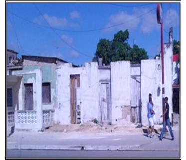
Calle Máximo Gómez (tres viviendas que fueron derrumbadas por su deterioro)

to se acabo la arena, no hay cabilla, el caso es que siempre falta algo que nos impide avanzar...>>