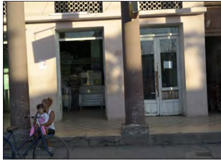
Farmacia donde se oferta medicina natural y tradicional

Podemos enumerar, entre muchos otros: Nimotuzumab, Nutrisol y Ferrical. Figuran además, el Abexol y el Prevenox; ambos, indica-