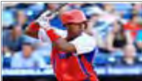
Campo corto, Erisbel Arruebarruena

Redacción: El torpedero cubano, Erisbel Arruebarruena, llegó a un acuerdo preliminar con el equipo de las grandes ligas Los Dodgers.