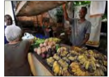
Prevalecen los altos precios en las ferias agropecuarias

Los géneros agrícolas, proporcionados por un total de 15 Cooperativas de Créditos y Servicios (CCS) y Cooperativas de Producción Agropecuaria (CPA), son ofertados