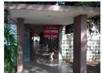
Escuela primaria Camilo Cienfuegos, de Los Arabos

forzosamente, sea cual sea la distancia al hogar, a regresar desde lejos. Hay estudiantes que viven en el Crucero Hondo, alejado a más de tres kilómetros. Otros son del Batey Prende, a distancia parecida. En este último, fue cerrada la escuela por escasez de maestros.