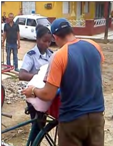
Policía registra en plena vía pública propiedades de un ciudadano

Es muy común, ser interrumpido en el traslado hacia los centros laborales, en horas tempranas y por un periodo de tiempo, que señale al trabajador, con llegadas tardes a sus puestos de trabajos, sin justificación. Padres, que de la mano de sus hijos, son sometidos a vergüenzas similares. Maestros, obreros, médicos, estudiantes, ancianos y personas que subsisten, según la legislación, son colocados en igual balanza de ladrones, delincuentes y antisociales, sin que medie la distinción de hombres y mujeres según sus valores.