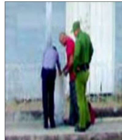
La policía registran en la calle pertenencias de este ciudadano

Pese a la realidad que sufre día a día el cubano de a pie, al dobles de las páginas grises de la isla, se coloca Cuba como: signataria de la Declaración Universal de los Derechos Humanos de las Naciones Unidas, la cual contiene una cláusula que denota los derechos fundamenta-