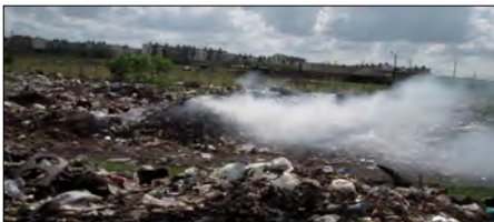
Basurero próximo al poblado de Los Arabos

Los Arabos, Matanzas. Quién pudiera imaginar, con tantos convenios sobre protección ambiental firmados, que en Los Arabos, hay días imposibles de respirar aire puro.