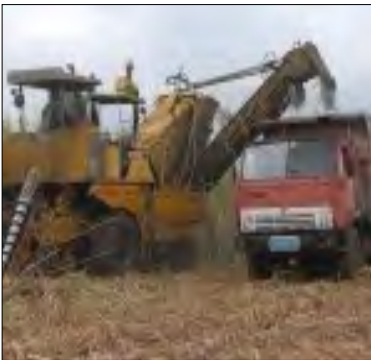
Corte de caña al Este de la provincia de Matanzas

Colón, Matanzas. Los centrales René Fraga y Méjico, de la provincia de Matanzas, pagan salario inferior a sus trabajadores. Para ello, se valen de las cantidades devengadas por estímulo. Situación, originada por estar inmersas, dichas entidades, en una deuda de 25 millones de pesos en moneda nacional (MN), con el Estado.