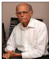
Comandante Hubert Matos

Redacción: El comandante, Hubert Matos Benítez, murió en la madrugada de este jueves, 27 de febrero, dijeron fuentes cercanas a su familia. Tenía 95 años. Según los familiares, Matos, sufrió un ataque masivo al corazón y falleció mientras recibía atención médica en el hospital Kendall de Miami.