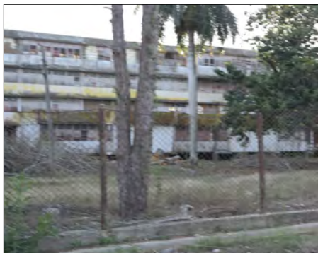
Antigua escuela formadora de maestros Roberto (Coco) Peredo, de Colón

Sin mediar reparaciones o mantenimientos útiles, desde tal época, el deterioro del centro