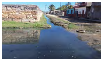
Insalubridad en las calles de Cárdenas

Conocida como la perla del norte atesora antiguas leyendas de prosperidad y belleza. Navegantes de todo el mundo sabían más de Cárdenas que del resto de Cuba. La indolencia, la incompetencia política y la falta de compromiso moral con sus habitantes,