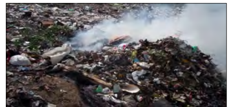
Proceso de incineración en el basurero de Los Arabos

Todavía, el martes 4 de febrero, la sensación sofocante persistía en calles y hogares. Sobre todo, por la incineración de jabas de nylon, neumáticos de autos y plásticos abundantes en estos lugares. Mientras aparece la solución,