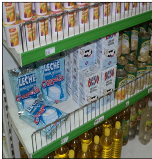
Venta de productos lácteos en las Tiendas Recaudadoras de Divisas (TRD)

Con los nuevos mecanismos económicos impuestos a las CCS, la leche llega a las dependencias estatales sin inter-