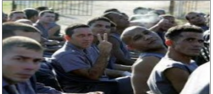
Jóvenes reclusos en Centro Penitenciario