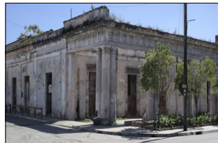
Antigua Estación Sabanilla, patrimonio de la ciudad de Matanzas, en total abandono