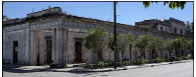
Estación Sabanilla la más antigua de América Latina en deplorable estado de conservación

Colón, Matanzas. Deplorable estado de conservación, presenta la estación ferroviaria más antigua de América Latina. La Estación Sabanilla, espera desde hace más de tres años por la recuperación de su monumento estructural.