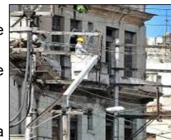
Trabajador eléctrico en labores de reparación

Entre muchos ejemplos citamos: El viernes 3 de enero, el circuito Z-130 presentó varios apagones entre 4 y 5 minutos, el miércoles 8, la zona industrial estuvo afectada sin el servicio por 1 hora y 20 minutos, el sábado 11 de este