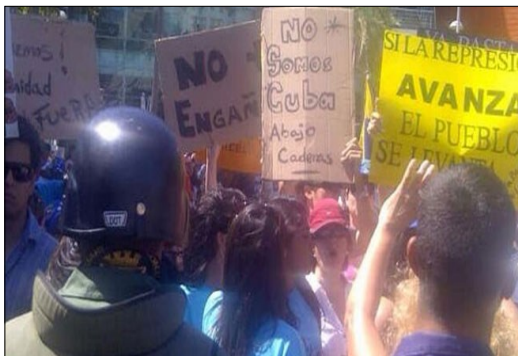
Manifestación de venezolanos, ante la llegada del equipo cubano de beisbol

Mientras fuerzas combinadas de la Guardia Nacional y la Policía del Estado, Nueva Espar-