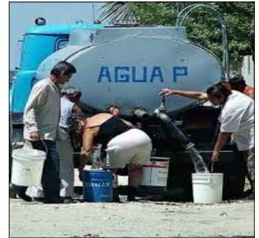
La escasez de agua provoca grandes dificultades en la isla

Una anciana de 80 años de edad, dijo a este redactor: <<Yo no puedo dar $500.00 pesos por una pipa de agua, porque sólo cuento con un retiro de $200.00 pesos, gracias a