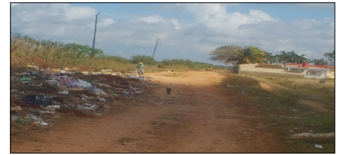
Desechos sólidos cierran camino al norte de la ciudad

humana. Sus oficinas pueden estar limpias pero cuando toman la calle lo hacen sobre sus automóviles, a través de las arterias viales que si reciben atención.