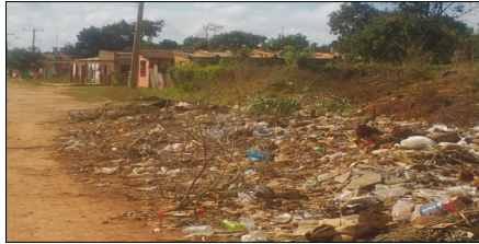
Basurero próximo al poblado de Perico

Y es una realidad, sólo queda un pequeño trillo para los autos y bicicletas, según se aprecia en las imágenes mostradas en este reporte. Lugar donde hace unos meses se realizó un intensivo que logró cambiar el foco de salubridad provocado por el colapsado Sistema de Recogida de Desechos Sólidos del Municipio.