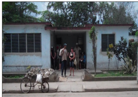
Farmacia Municipal de Los Arabos

El suministro semanal arriba, a Los Arabos, el martes. El resto del día es utilizado para recep-