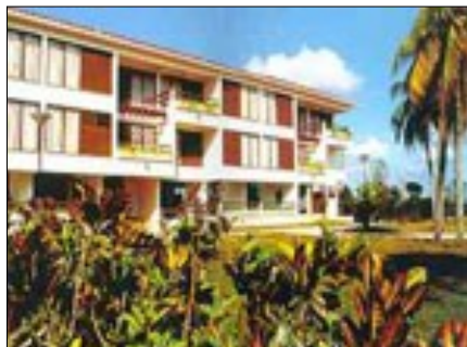
Hotel Canimao enclavado en las afueras de la ciudad de Matanzas

El hotel, depende en un porcentaje considerable de la Empresa de Acueductos y Alcanta-