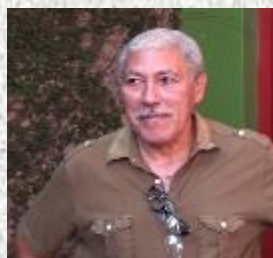
Pedro Pablo Oliva

Una vez más se le niega al pintor Pedro Pablo Oliva, Premio Nacional de Artes Plásticas, el derecho a exponer en el Museo de Artes de Pinar del Río, al ser considerada su exhibición como