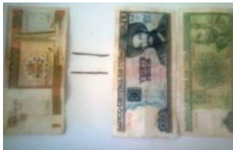
1 cuc, equivale a 25 pesos cubanos

El principal objetivo que se persigue con la unificación monetaria, es devolverle al peso cubano su "valor" como moneda