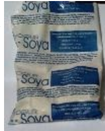
Bolsa de Yogur

Las bolsas en las que suele envasarse se exponen a la venta enfangadas, llenas de tierra, sucias y mal olientes, lo que evidencia la inexistencia de cierta preocupación de parte del dependiente, al ofrecer el insumo a los compradores.