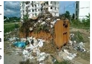
Imágenes de micro

De manera que, la ciudad necesita con urgencia que las autoridades gubernamentales presten tamaña atención a dichos problemas, ya que ellos cuentan