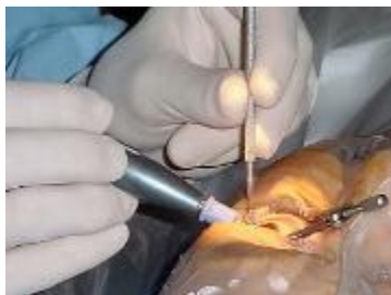
Operación de Catarata

En el Hospital Provincial Abel Santamaría de Pinar del Río, desde hace algún tiempo se vienen operando las cataratas sin que existan gotas dilatadoras. Es lastimoso y vergonzoso para un centro de esta categoría que no utilice este medicamento imprescindible, que además calma el dolor que se torna casi irresistible.