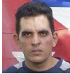
Por: Yaimel Rodríguez Arroyo

Desde hace aproximadamente un año está en litigio la construcción de una casa de curar tabaco, por la cercanía a las viviendas donde viven niños asmáticos, en el kilometro 7 carretera a la Coloma. Por todos es conocido que la hoja de esta planta al secarse desprende un polvo que se va al ambiente por las corrientes de aire y que por tanto los niños asmáticos se verían afectados por el mismo.