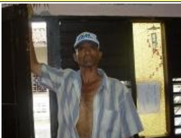
Imagen del Cuentapropista

Por otra parte la Ministra de Justicia María Esther Reus, reconoció recientemente que los quince mil inspectores estatales que laboran en nuestro país, no tienen preparación para ejercer sus funciones, entonces nos preguntamos, ¿Cómo es posible que los mismos estén acosando, persiguiendo y multando a diestra y siniestra a estos trabajadores, si no están aptos para el desempeño de su actividad. Por qué entonces las autoridades permiten que estos sigan trabajando en este sector?