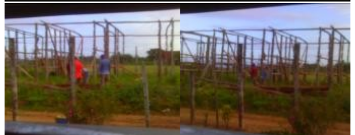
Imágenes donde se retoma la construcción de la casa de curar tabaco.

Lo cierto de todo esto es que ninguna autoridad se ha personado en el lugar para hacer que se cumpla la orden o de lo contrario darle una explicación convincente a las familias que se verán afectadas del por que se va a construir en ese sitio dicho local cuando este es un peligro potencial para la salud de los niños que padecen esa enfermedad tan molesta, como es el asma.