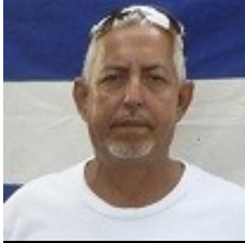
Por: Raúl L. Risco Pérez

La democracia cubana cuestionada, tildada de falsa e hipócrita por el pueblo de Cuba, si partimos de lo refrendado en la Constitución de la República y lo que realmente sucede en la vida cotidiana, esa que se sufre y padece.