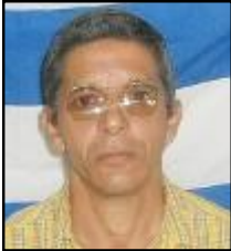
Por: Bernardo León Martínez

Hasta cuando los trabajadores por cuenta propia van a ser víctimas de la represión y hostigamiento por parte de la Policía Nacional Revolucionaria y los inspectores Integrales tanto provinciales como municipales ¿Qué escuela han pasado esas personas? Que no tienen ética para tratar con la población, es por eso que cada día hay más personas que atacan al régimen, ciudadanos que aunque participan en las actividades de masas, no dejan de reconocer y manifestar, aunque sea a ocultas, los abusos y maltratos en que vive nuestro pueblo.