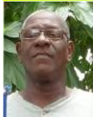
Por: Julián Alvares Rivera

La inexistencia de medios de comunicación privados en Cuba hace que el pueblo no conozca la verdad, y no se pueda publicar en ellos, como los funcionarios gubernamentales encargados de prestar servicios al pueblo y abastecer de alimentos al mismo, actúan cada vez más con mayor indolencia y falta de respeto a la dignidad humana.