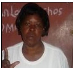
Por: Amparo M. Morejón Díaz

El gobierno de los hermanos Castro durante más de cincuenta años ha alardeado y engañado a todo el mundo con, según ellos los logros de la revolución, dentro de estos se incluye la salud pública, la que esta a nivel de países desarrollados.