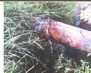
Imagen de salidero en conductora de agua potable

Tendremos algún día agua potable, se nos respetará nuestra dignidad como seres humanos, yo afirmo que sí, cuando todos nos unamos y exijamos nuestro derecho a tener una vida digna, porque el agua se agota, pero también se agota la paciencia y el aguante del cubano de a pie.