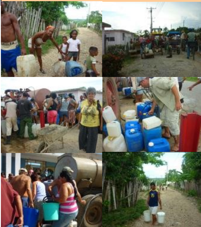
Imágenes del pueblo de Guane cargando agua potable.

Se verán horrores, y pienso que estos infelices guaneros de a pie tendrán que ir a ver a San Pedro, para que les resuelva el problema del agua, porque los dirigentes del gobierno local no lo harán.