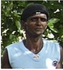
Por: Pedro L. González Díaz

La corrupción es un gravísimo mal que ha azotado el país, pero esto no es nuevo y mucho menos nos toma por sorpresa, pues en los países que componían el antiguo campo socialista, los corroía la corrupción, téngase presente que hoy los grandes empresarios en la mayoría de ellos, eran los antiguos dirigentes comunista.