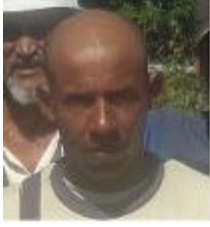
Por: Eudys Céspedes López.

La tormenta Andrea afectó seriamente la agricultura guanera en la que se vieron perjudicados muchos campesinos en sus sembrados de vianda y hortaliza, pero la mayor pérdida para la economía se concentra en el cultivo fundamental de la provincia, el tabaco.