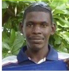
Por: Luis E. Monterrey Morejón

Recuerdo que hace muchos años, la televisión cubana ponían constantemente el anuncio que tiene por título el presente trabajo, y a diario me pregunto que si realmente el agua fuera un recurso no renovable ya en Cuba viviéramos como los gorgojos, porque mucha se pierde por el mal estado de la conductora al presentar muchos salideros.