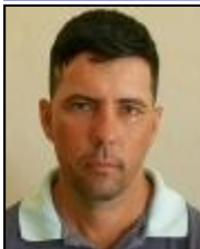
Por: Luis A. Ruiz Calderón Hernández

Nadie puede quitarme de la cabeza que la miseria que sufrimos cada día los cubanos, es en gran parte diseñada por el gobierno. Pienso que a la ineficiencia congénita de este sistema totalitario se le suma la marcada intención de los tiranos, de que al cubano siempre le falte algo, que le impida el tranquilo disfrute de la vida.