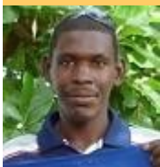
Por: Luis E. Monterrey Morejón

Existen muchas formas de maltrato a la población, desde la violación de sus derechos como seres humanos, hasta la calidad e higiene con que se presta un servicio. El caso que expondré a continuación es un ejemplo más entre los tantos que se dan a diario de maltrato al pueblo.