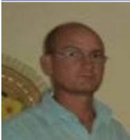
Por: Rigoberto González Vigoa

El nacimiento sigue siendo una de las prioridades del Estado cubano, por ello se han dictado una serie de normas jurídicas que así lo protegen.