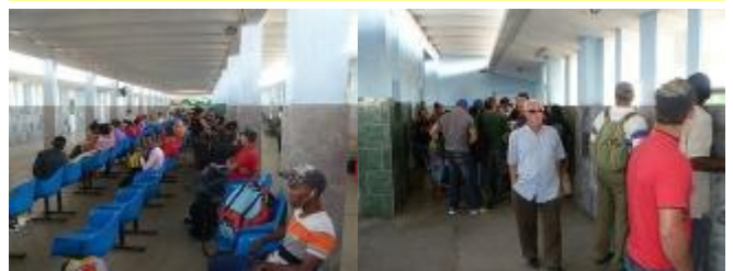
Imágenes de la terminal de ómnibus

Lo triste es que el cubano se ha acostumbrado tanto al maltrato, como a tantas otras cosas inexplicables que nos suceden a diario, nos preguntamos, ¿Es que el pueblo no tiene derecho a un transporte digno?, ¿Por qué los inspectores y policías acosan tanto al transportista privado si el gobierno no garantiza el transporte adecuado y necesario?