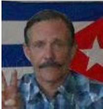
Por: Pedro A. Padrón Amor

Cada día se arruina más la industria tabacalera en esta provincia Pinar del Río, y como no tengo todos los elementos a mi alcance, no puedo afirmar si sucede lo mismo en el resto del país.