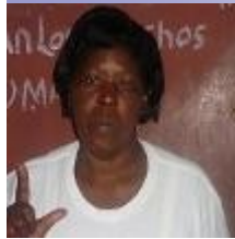
Por: Amparo M. Morejón Díaz

La indiferencia, indolencia y falta de sensibilidad humana ante el dolor ajeno, son hoy en nuestro país muestra de la pérdida de valores en la sociedad cubana.