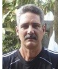
Por: Emilio Carrillo González

Si un pueblo unido jamás será vencido, cuanto más lo serán dos pueblos; Tremenda unidad es la que se logra en la terminación de ómnibus provincial de Pinar del Río, cuando con una sola guagua se trata de transportar el pasaje de dos municipios (San Juan y San Luis), la gente se une tanto que casi se funden entre sí, lo mismo ves a un anciano de 80 años bien pegadito a una niña de 15, que a una temba de 50 soldarse con un joven de 21, es tanta la unidad que en ocasiones no se sabe quién es uno, ni quien es el otro.