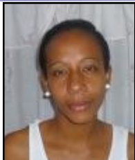
Por: Yanisleidy Ramos Soto

Este es mi país y lo amo, no pertenezco a ningún grupo opositor, porque estoy convencida que de incorporarme alguno de inmediato seré enviada a la calle.