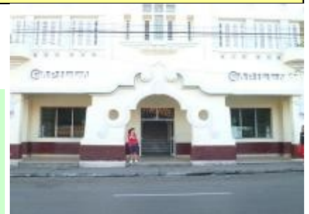
Imagen de la funeraria, Pinar del Río

Pinareños y pinareñas, no se debe tener miedo al exigir tus derechos, ya que nadie está autorizado legalmente a reprimir ninguna manifestación de exigencia de respeto a tu dignidad como persona.