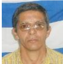
Por: Bernardo León Martínez

El departamento de enfrentamiento de la Seguridad del Estado, es el órgano encargado de la represión a los opositores pacíficos en nuestro país, donde trabaja un grupo de oficiales, conocidos como la Policía Política.