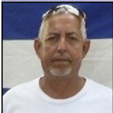
Por: Raúl Luis Risco Pérez

Desde hace ya muchísimos años, las autoridades cubanas vienen conduciéndose con total desconocimiento de la legalidad. Al parecer un nuevo “delito” no contemplado en el Código Penal y en la Ley de Procedimiento Penal, han comenzado a aplicar ante determinadas circunstancias en las que se desenvuelve la oposición pacífica cubana.