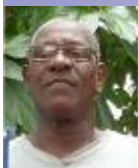
Por: Julián Álvarez Rivera

La represión y persecución que masivamente lleva el régimen para tratar de sofocar la verdad que llevan los disidentes y opositores al pueblo de Cuba, hacen que la unidad y fortalecimiento de la Alianza democrática Pinareña sea cada vez mayor, ya que es un deber de cada activista transmitir dentro de la sociedad civil nuestros programas de lucha, explicar que somos defensores de los Derechos Humanos y no terroristas o mercenarios como suelen llamarnos despectivamente los totalitarios.