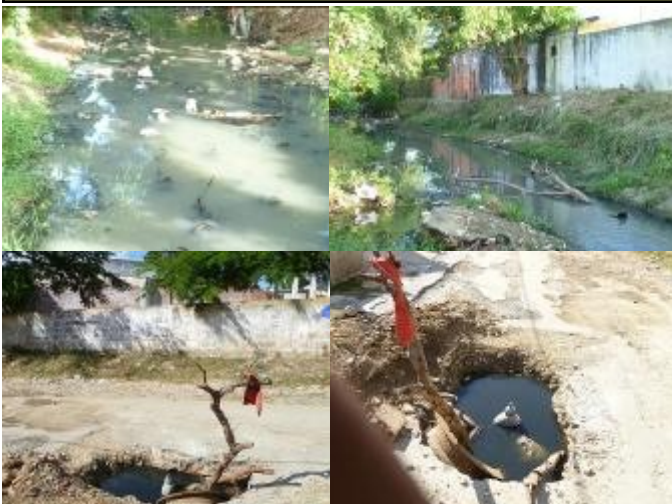
Imágenes del Arroyo Galeano y tuberías de agua potable contaminada.

Por otra parte los vecinos de este reparto que viven a ambos lados de los márgenes del ya mencionado arroyo, el cual es utilizado para verter las aguas negras de esta parte de la ciudad, se han quejado por el mal olor reinante, así como han pedido al gobierno se separe la tubería de agua potable de la tubería de aguas albañales, ya que ambas presentan filtraciones y roturas, trayendo como consecuencia la contaminación del agua potable.