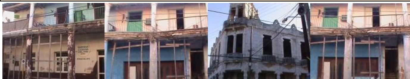
Imágenes de zonas urbanas en derrumbe en la ciudad de Pinar del Río.

NO LO GUARDES, ENTREGALO A TUS VECINOS Y AMIGOS.