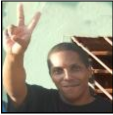
Por: Yasser Reinoso Ramos

La grave situación de alimentación por las que atraviesan los presos cubanos, no es reconocida por el gobierno y miente únicamente a la opinión pública nacional e internacional, mientras miles de reos en las cárceles cubanas se mantienen bajos de peso y desnutridos.