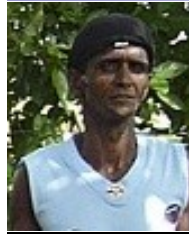
Por: Pedro Luis González Díaz

Por mucho que el gobierno trate de mostrar imágenes de reclusos que compran por un pabellón conyugal, un pase a su hogar, o una visita de estímulo extra, la realidad en la que viven los penados en Cuba es bien diferente y muy bien conocida por la inmensa mayoría del pueblo cubano.