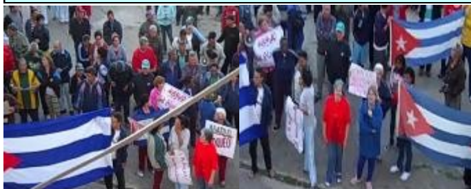
Imágenes de mitin de repudio contra defensores de los Derechos Humanos.

¡Vivan los líderes por los Derechos Humanos!