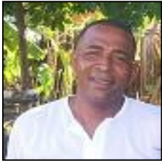
Por: Rafael Hernández Blanco

En el sector de los Servicios Comunes son importantes las condiciones de seguridad e higiene del trabajo, que se debe aplicar en todo los centros de producción y servicio del territorio del municipio de Guane, para un buen desempeño del trabajo y en la protección del individuo.