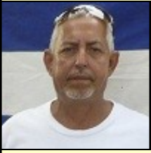
Por: Raúl Luis Risco Pérez

El pasado 1ro de mayo, en nuestro país, lejos de ser un día de fiesta y celebración para los trabajadores, se convirtió en un día de bochorno y vergüenza nacional.