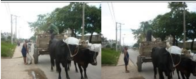
Imágenes de medios utilizados para recoger basura

Llamamos a que deben adoptarse por parte de la administración de Comunes del municipio todas las medidas pertinentes y necesarias para que los equipos y medios de trabajo de estos trabajadores sean adecuados a la actividad que realizan, de modo que garanticen la Seguridad y la Salud de sus empleados.